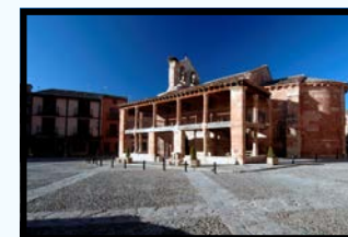
Église de San Miguel