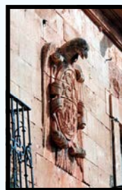
La maison de l'aigle