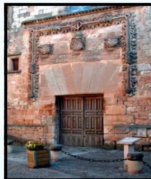
Le Palais des "Contreras"

Quelques uns des exemples les plus remarquables :