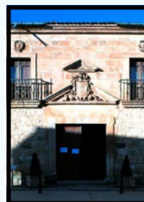
Le Palais des "Obispo del Velloso"